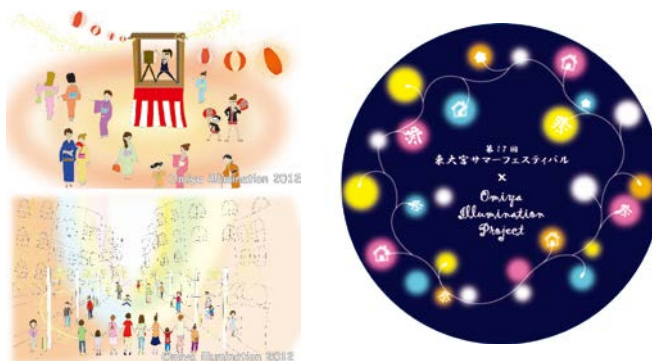
Pict.8 広報用「フライヤー」と「手作りうちわ」

② 東大宮中央公園 サマーフェスティバルで の夏『夏祭りイルミネーション』 学生プロジェクト「見沼 Face to fance プロジェクト」と共に東大宮中央公園 サマーフェスティバルでイルミネーション設置活動及び活動のPRを行いました。今回は本学周辺の近隣住民の方々とのふれあひも出来ました。広報活動では、夏にちなみ、広報用「フライヤー」と「手作りうちわ」(Pict.8)を作成しました。秋・冬のイルミネーションに多くの方々に参加してくれますように。