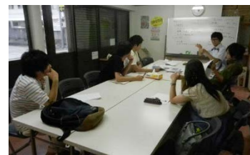
Pict.6 第二回宮一サミット栗原理事長との会議の様子。