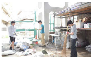
Pict.1 大宮・資材置き場の掃除の様子。