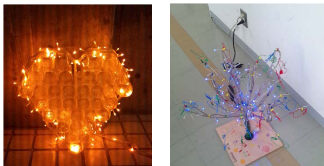
Pict.10 スタディ品制作結果

④ 秋「オブジェクト・イルミネーションの制作方法のスタディ イルミネーションの制作方法をメンバーで検討しました。 子どもたちの安全・作りやすさ・町の人達による見えを判断材料に最高の作品が小学生により、街を彩ることをイメージしつつ日々検討中です。(Pict.10)