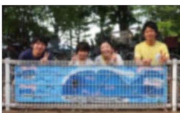
Pict.3 東大宮サマーフェスティバル参加者との写真