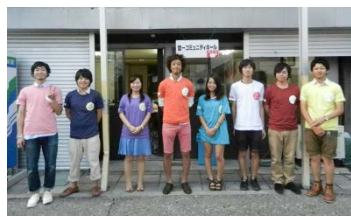
Pict.5 第二回宮一サミット栗原理事長との会議の様子。