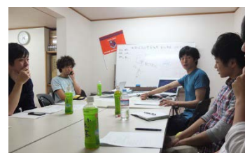
Pict.2 第一回宮一サミット栗原理事長との会議の様子。