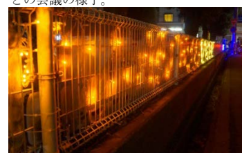
Pict.4 東大宮サマーフェスティバルのイルミネーション点灯シーンです